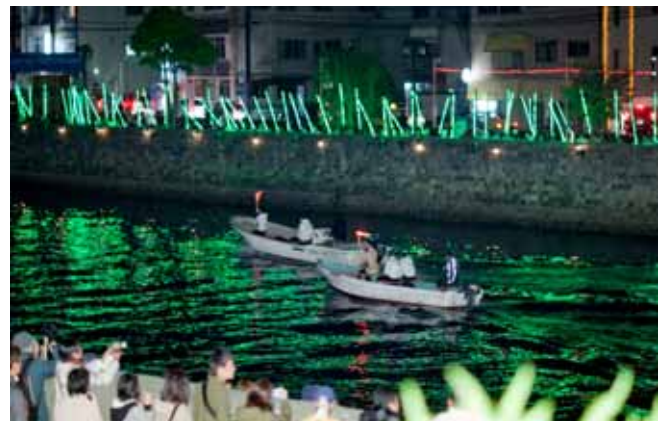
写真2 「照明の音楽」企画・構成・演出：野村幸弘 1回約500人参加による音と光のパフォーマンス 会期中2回上演(約860人の参加を得る)